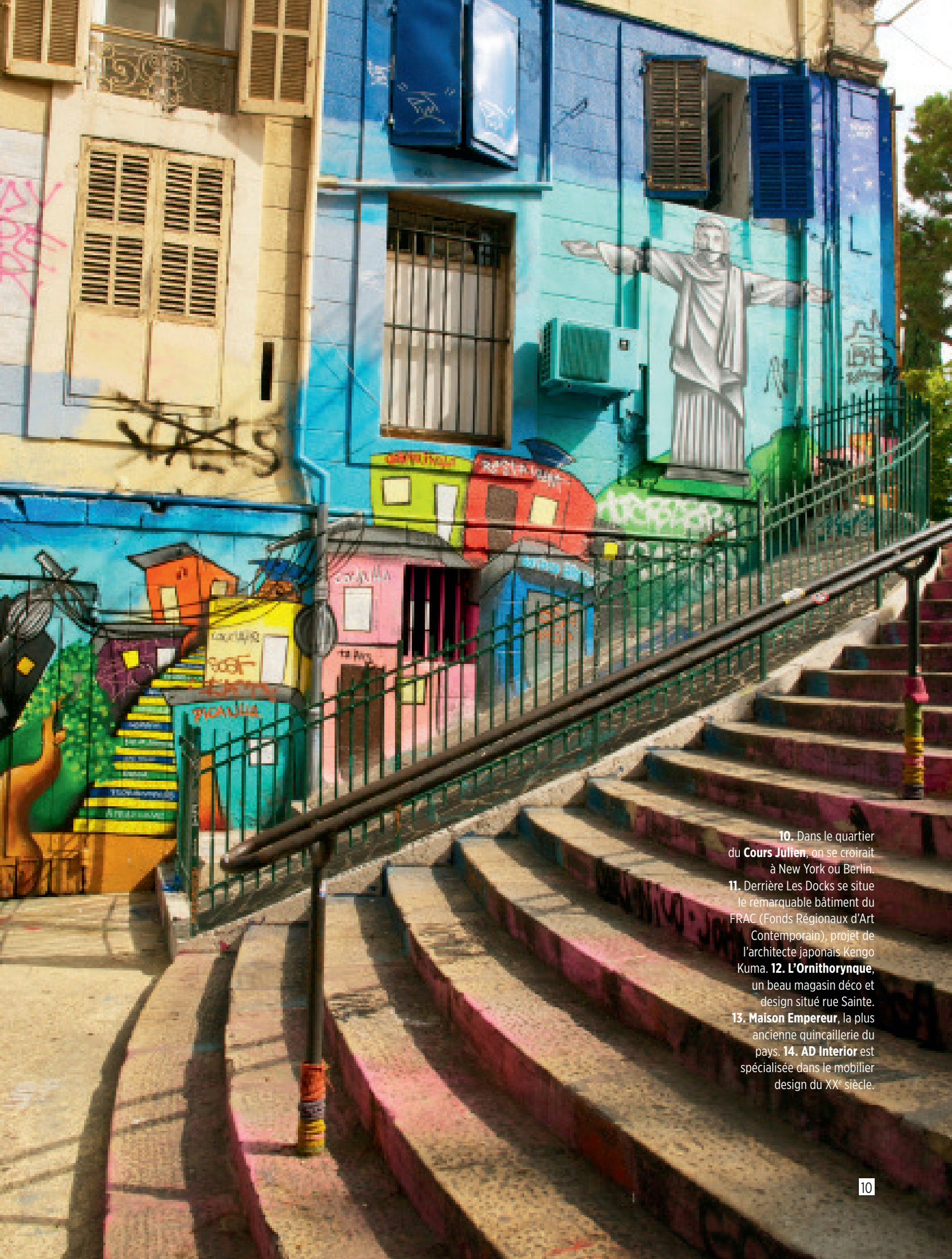
10. Dans le quartier de Cours Julien , on se croirait à New York ou Berlin. 11. Derrière Les Docks se situe le remarquable bâtiment du FRAC (Fonds Régionaux d'Art Contemporain), projet de l'architecte japonais Kengo Kuma. 12. L'Ornithorynque , un beau magasin déco et design situé rue Sainte. 13. Maison Empereur , la plus ancienne quincaillerie du pays. 14. AD Interior est spécialisée dans le mobilier design du XX e siècle.